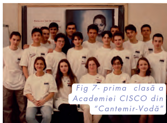
Fig 7- prima clasă a Academiei CISCO din “Cantemir-Vodă”

mai mulți copii dorind să participe. Datorită activității desfășurate și a rezultatelor obținute, în anul 2002, ea a fost declarată “Academia CISCO a anului în spațiul EMEA”.