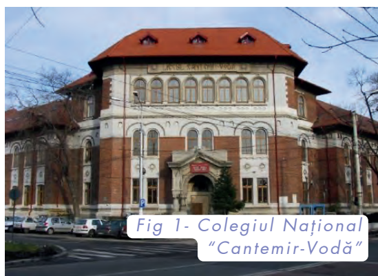
Fig 1- Colegiul Național "Cantemir-Vodă"

Materialul prezintă evoluția informaticii și a realizărilor, dar și a provocărilor elevilor și ale profesorilor din "Cantemir - Vodă", începând cu anul 1985.