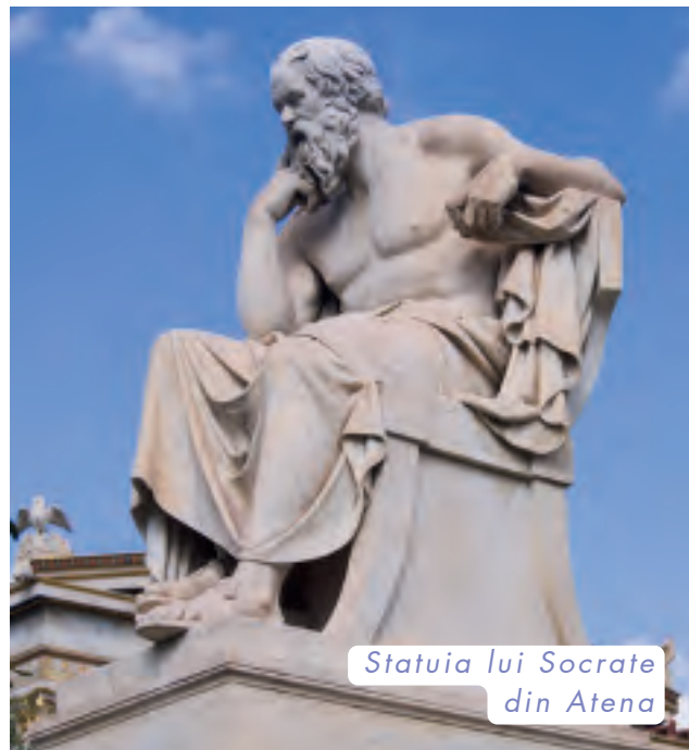
Statuia lui Socrate din Atena

Asemănător lui Socrate, și Platon a avut la rândul său discipoli, unul dintre ei fiind Aristotel.