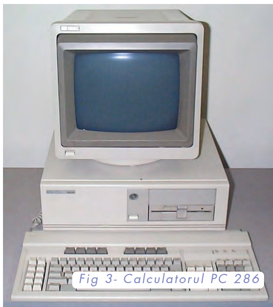
Fig 3- Calculatorul PC 286

Am început să participăm la primele olimpiade de informatică și rezultatele nu au întârziat să apară. Colegii de la Liceul de Informatică "Tudor Vianu" au început să se întrebe de unde am apărut... Da, a fost ca un miracol, ce ne-a dat aripi în lupta noastră cu informatica. În anul 1991 un părinte a donat laboratorului un PC 286 care a stârnit numeroase emoții și curiozități. Copiii care mai văzuseră așa ceva pe la serviciile părinților lor, au început să butoneze la el și să demonstreze ce se poate face cu un astfel de calculator.