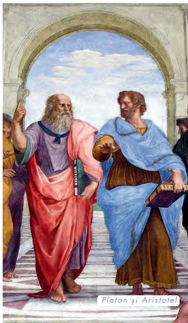
Platon și Aristotel