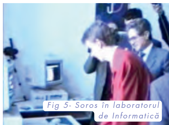
Fig 5- Soros în laboratorul de Informatică

dar ea s-a prelungit deoarece elevii doreau să-i prezinte cât mai multe din realizările lor. A fost de-a dreptul impresionat de ceea ce a văzut, astfel că proiectul a fost implementat în zeci de licee din toată țara. Ca urmare a acestei vizite, G. Soros a anunțat finanțarea accesului la internet pentru școlile din România.