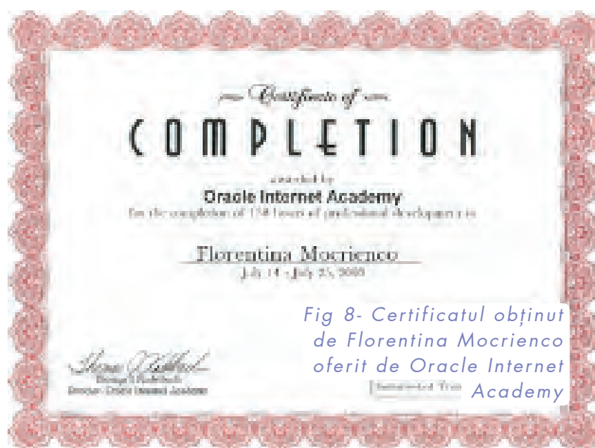
Fig 8- Certificatul obținut de Florentina Mocrienco oferit de Oracle Internet Academy

Și-am încălecat pe-o... tastă și v-am spus povestea toată!