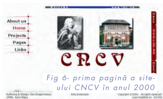
Fig 6- prima pagină a site-ului CNCV în anul 2000