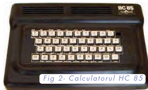
Fig 2- Calculatorul HC 85