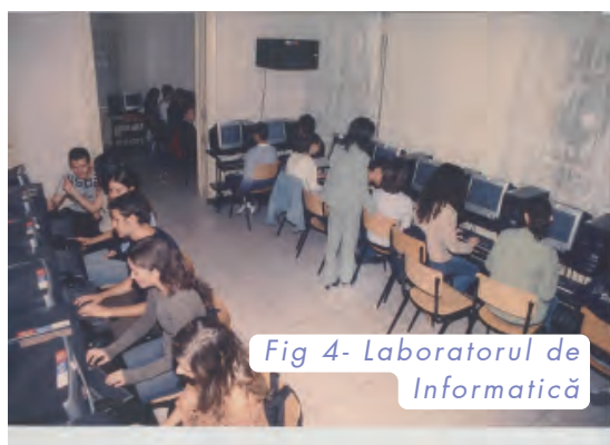
Fig 4- Laboratorul de Informatică

“Cantemiriști” și să deslușească tainele informaticii la noi. Laboratoarele erau pline mereu, până noaptea târziu.